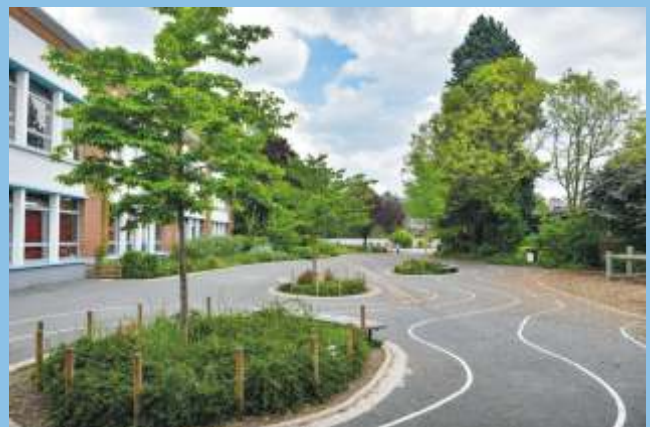
Exemple de végétalisation d'une cour d'école

Face au changement climatique et aux vagues de chaleur, il est aujourd'hui indispensable de renforcer la place de la nature en ville et particulièrement dans les cours de l'école. La municipalité prévoit de les réaménager : un projet de désimperméabilisation et de végétalisation est en réflexion, en concertation avec les enseignants et le soutien de MATEC (Moselle Agence Technique) et du CAUE (Conseil d'Architecture, d'Urbanisme et de l'Environnement).