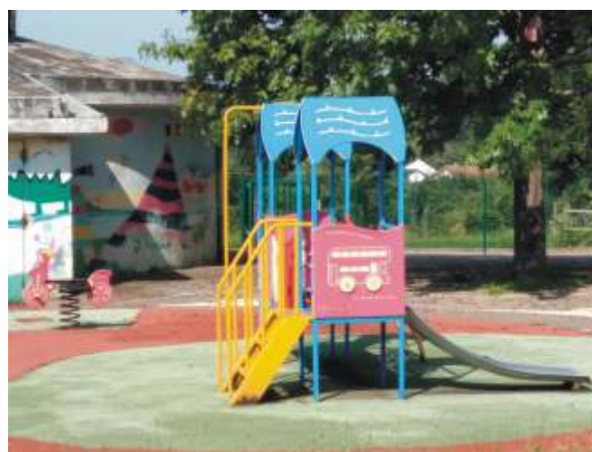
Remise en peinture des jeux de l'école