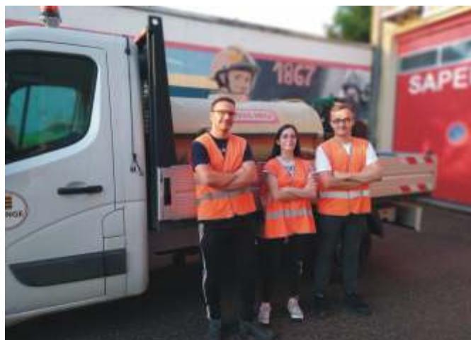
Groupe du mois d'août