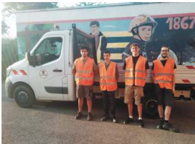
Groupe du mois de juillet