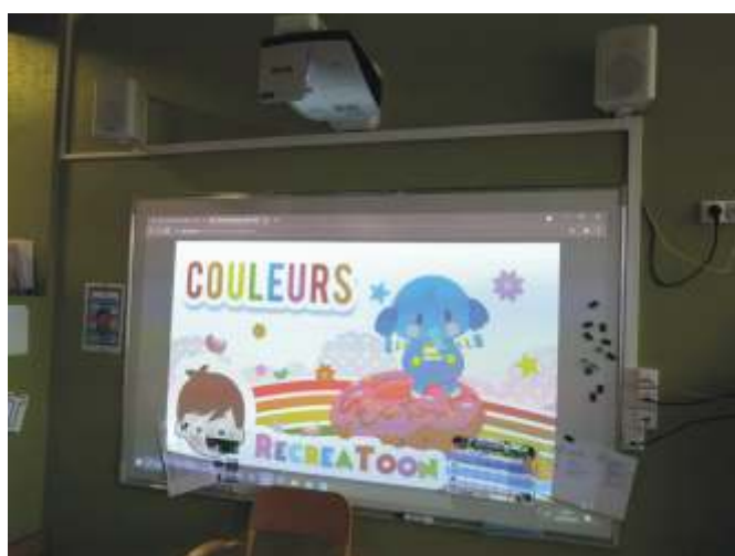
Tableau blanc interactif

Installation d'un tableau blanc interactif dans une classe de maternelle, ce qui finalise l'équipement complet de tout le groupe scolaire.