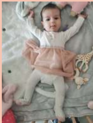
Sophia SOUMANN née le 10/06/2021