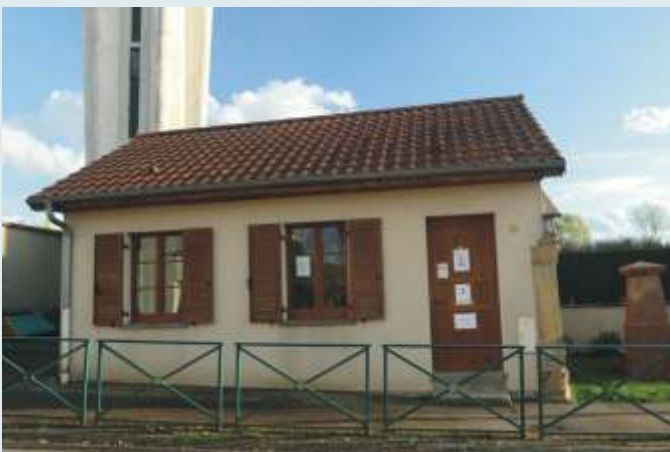
Local du château d'eau : salle d'activités municipales pour les enfants et les jeunes du CMJ. Accueille également certaines associations.