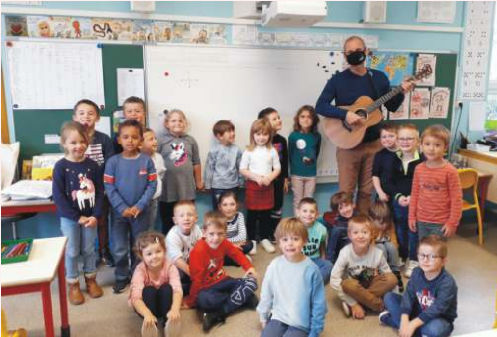
Répétition du concert du 4 octobre (moyenne et grande sections)