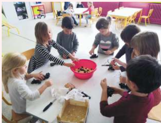
Semaine du goût (petite et moyenne sections)