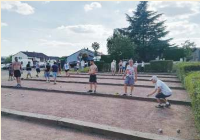
Le boulodrome, remis en état au printemps, est un lieu d'échange intergénérationnel autour d'un sport convivial et de détente.