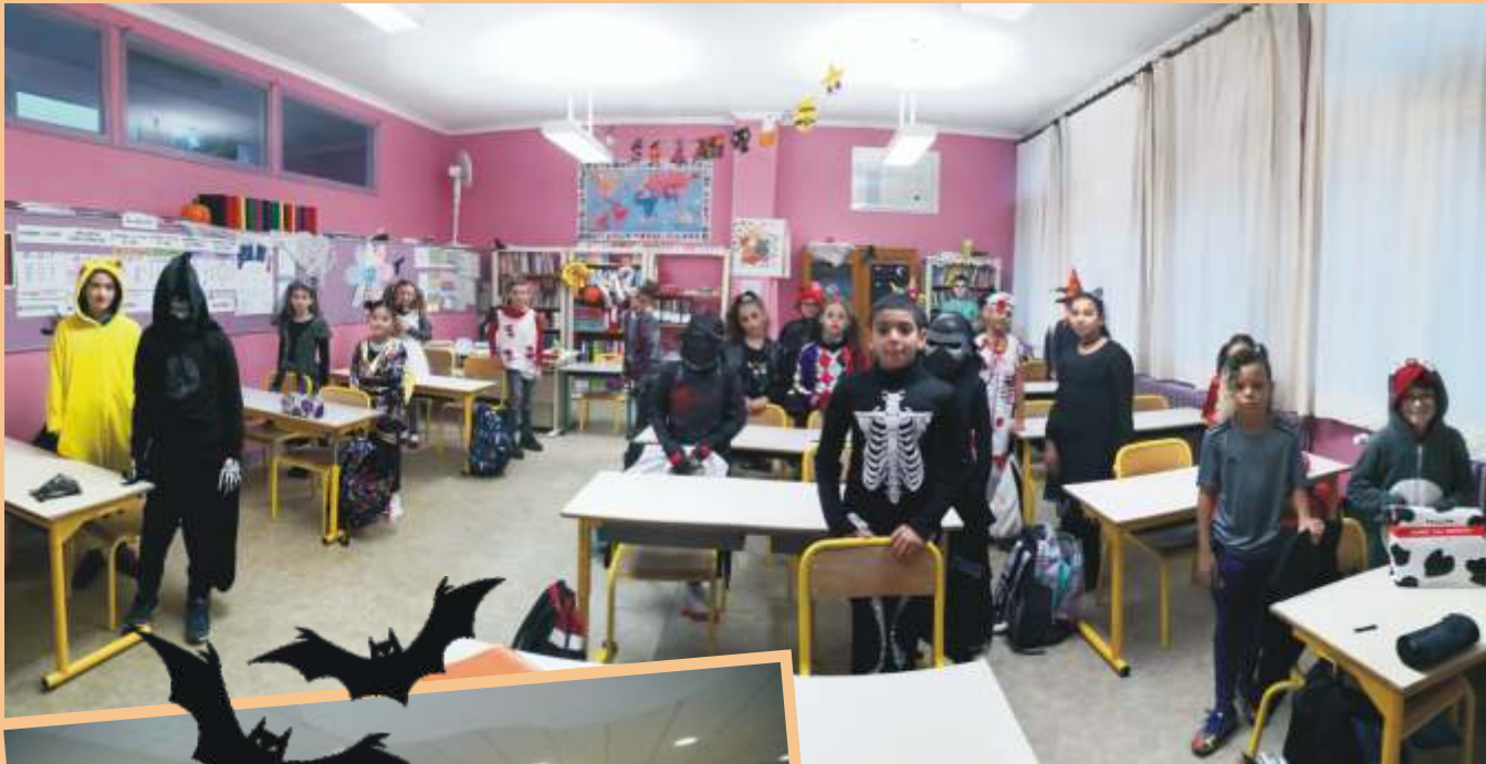
Classe des CM2