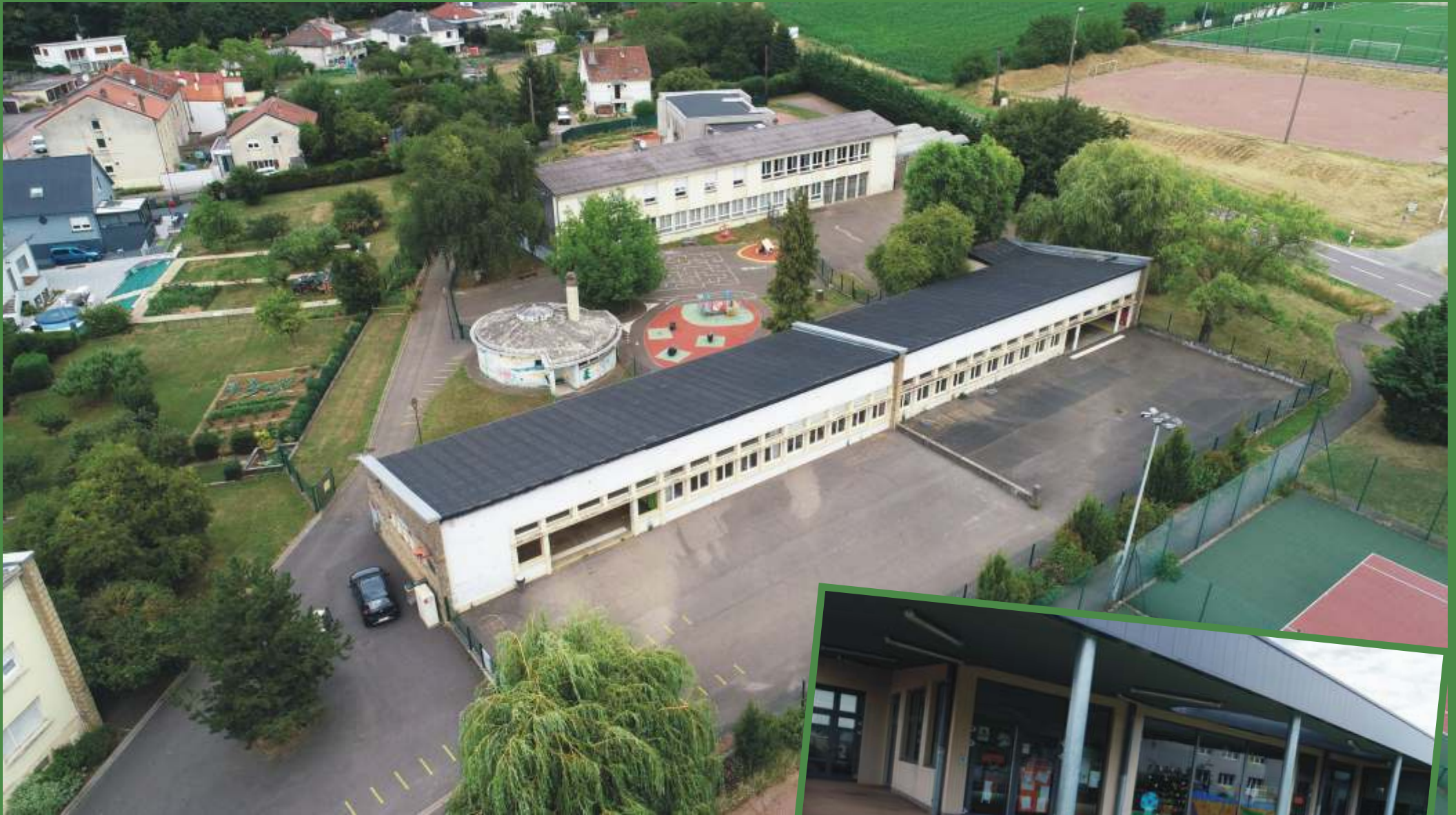
Groupe scolaire Jean de la Fontaine