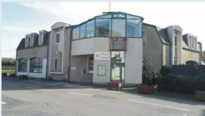
Le centre culturel : deux salles destinées à des manifestations culturelles mais aussi lieu d'accueil du goûter du Bel Age le jeudi après-midi.