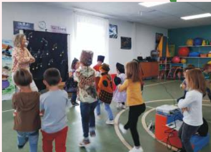
Spectacle maternelle : Tao au rythme des musiques du monde