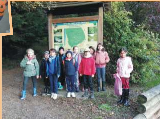
Activités municipales durant les vacances d'automne