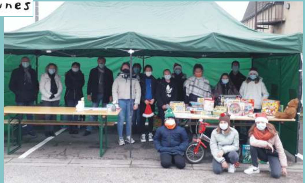
Collecte de jouets au profit d'enfants placés ou en grande précarité