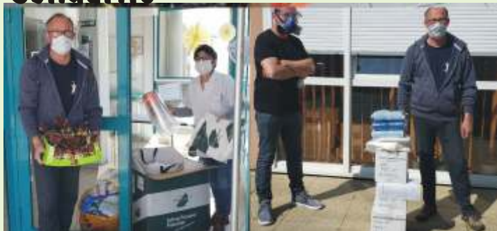
AICNI : Fourniture de matériels de protection à l'Ehpad ainsi que distribution de chocolats de Pâques pour nos aînés.