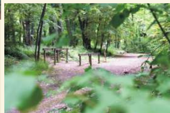
Le parcours de santé propose une promenade sportive en plein milieu de la forêt.