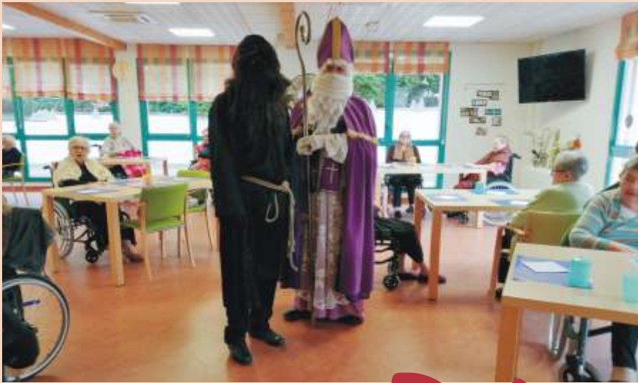
Saint Nicolas et Père Fouettard à l'Ehpad