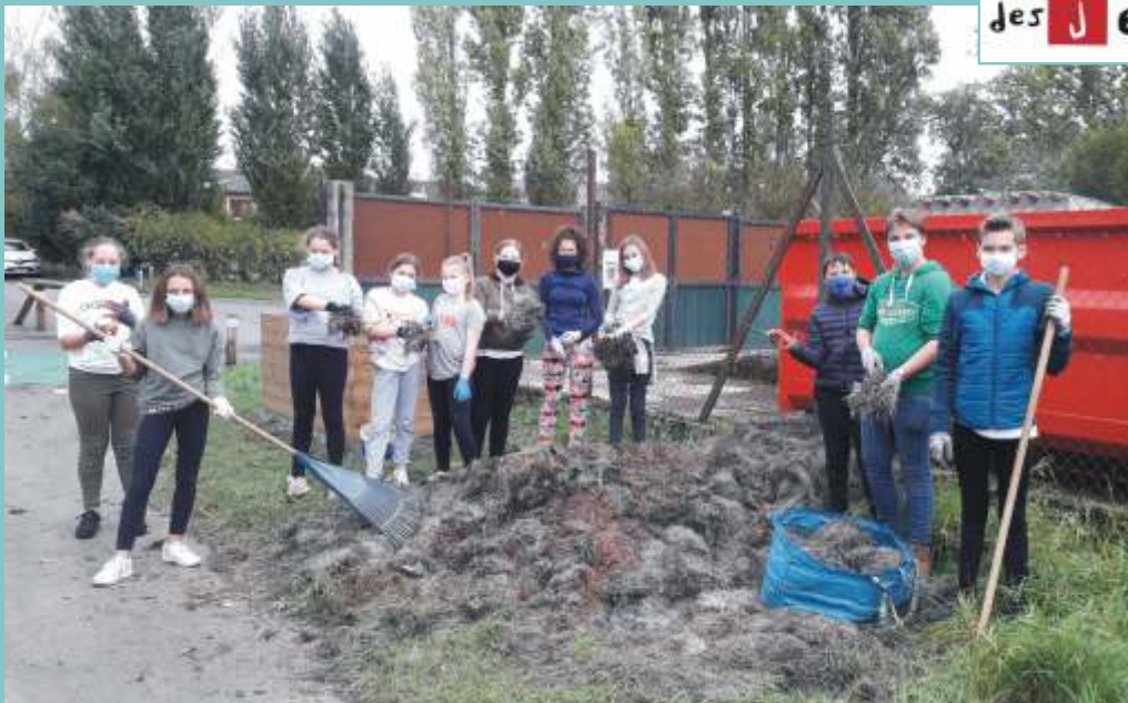
Installation d'un bac de plantation en permaculture