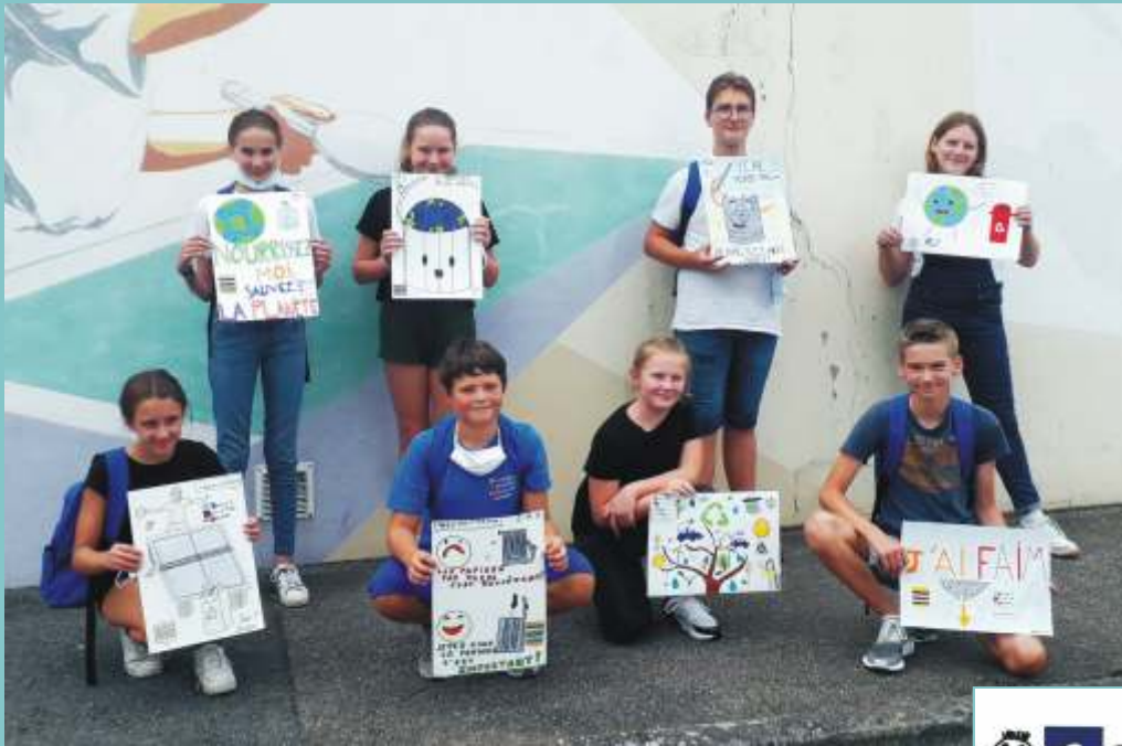
Création d'affiches pour inciter à utiliser les poubelles

Cela va bientôt faire deux ans que ces douze jeunes se sont engagés. Ils sont acteurs de leurs projets et prennent part à la vie de la commune, en participant tout au long de l'année aux commémorations officielles et aux diverses manifestations.