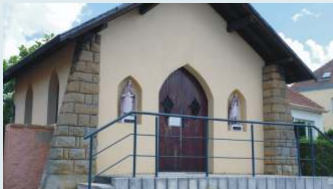
La chapelle Saint Roch est devenue, depuis 12 ans maintenant, un espace d'expositions et de présentations. Compte tenu de la situation actuelle, les expositions sont temporairement délocalisées dans la vitrine du centre culturel. Vous trouverez le programme 2021 ci-joint !