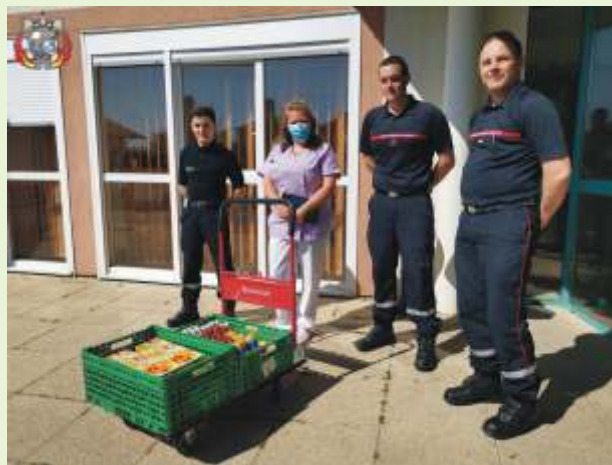
Don des pompiers en faveur de l'Ehpad