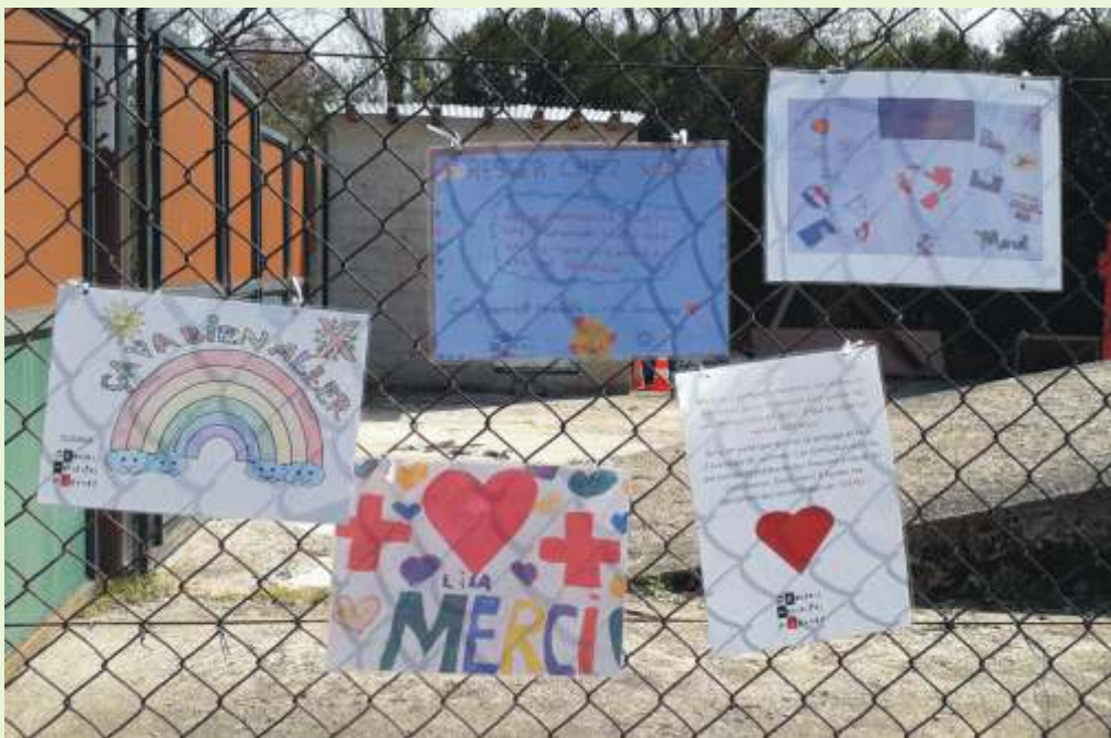
Dessins et messages du CMJ

Retour sur une période troublée... Nous sommes entrés en guerre contre un virus qui nous a obligé à remettre beaucoup de choses en question. Pour certains la vie s'est ralentie, pour d'autres au contraire tout s'est accéléré... A Illange comme ailleurs, de nombreuses actions ont été réalisées pour tenter d'adoucir ce confinement.