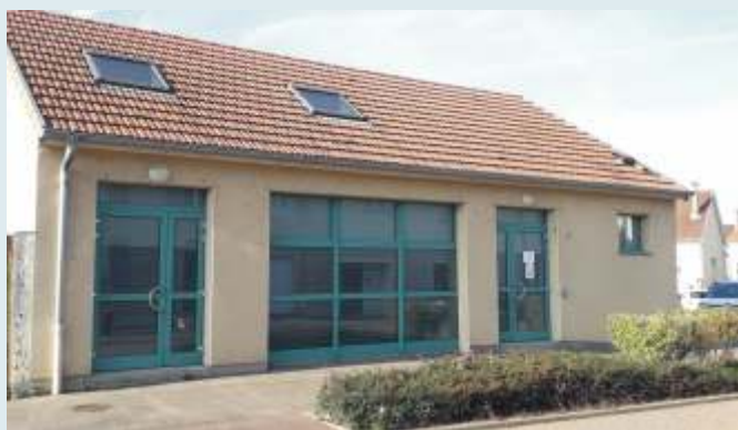
Salle multifonctions : salle d'activités culturelles et de formation, qui dispose depuis cette année d'un écran géant pouvant être utilisé pour les séances de ciné ado organisées par le CMJ ou lors de formations. Cette salle peut aussi être louée pour des réceptions (en journée uniquement).