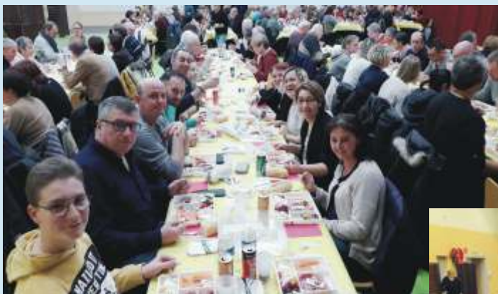
Traditionnel repas des illuminations pour récompenser tous ceux qui participent par leurs décorations, à l'embellissement du village durant les périodes de fêtes.