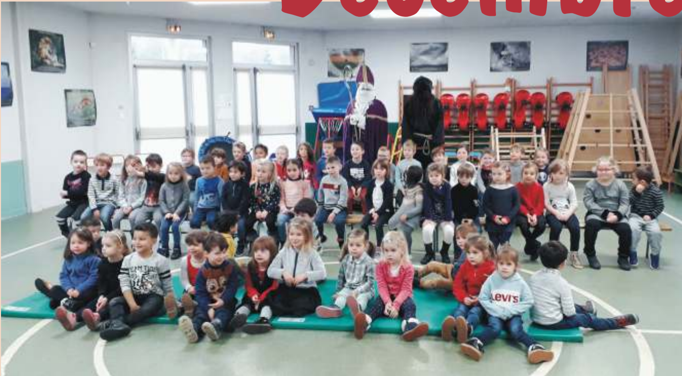
Visite du patron des écoliers à l'école. Chaque élève s'est vu remettre un paquet de friandises !