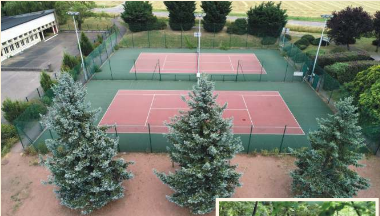
Deux courts de tennis extérieurs sont mis à disposition des adhérents du club de tennis.