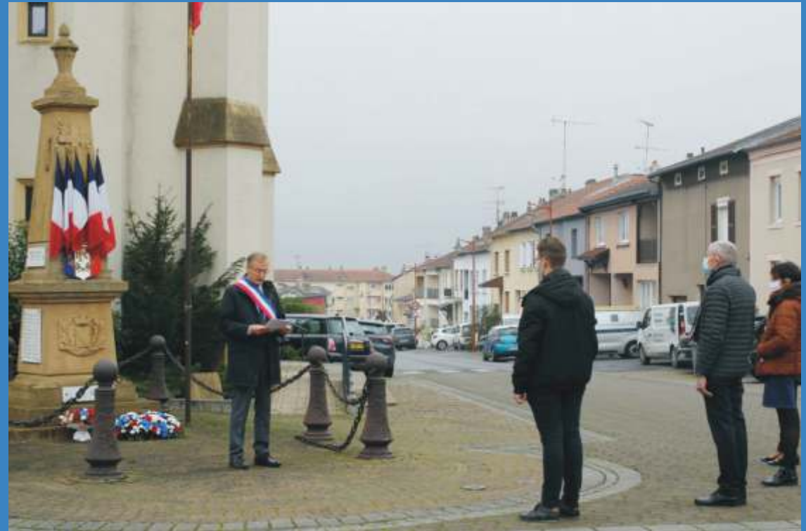
Cérémonie du 11 novembre 2020