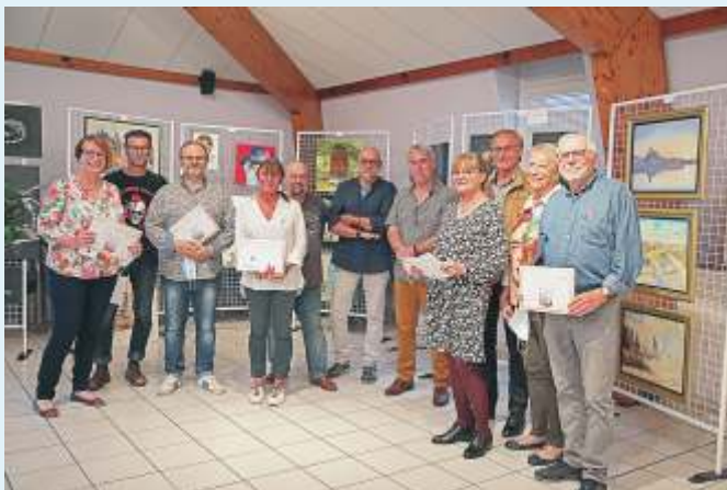
Salon de la Peinture