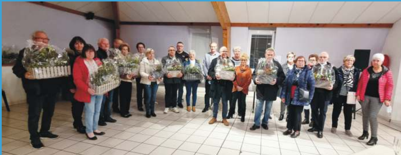
Remise des prix du concours des maisons fleuries