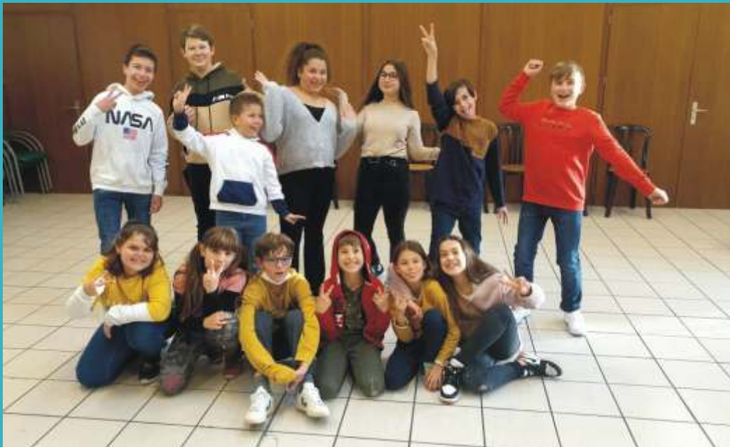
Atelier théâtre de l'Île en Joie