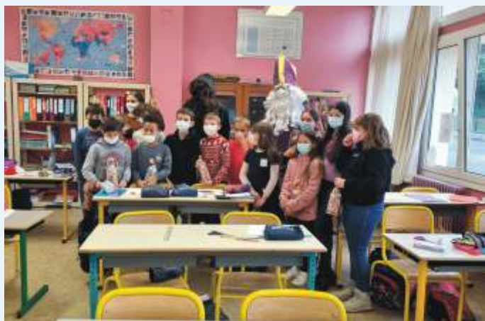
Visite de Saint Nicolas aux élèves de l'école Jean de la Fontaine"