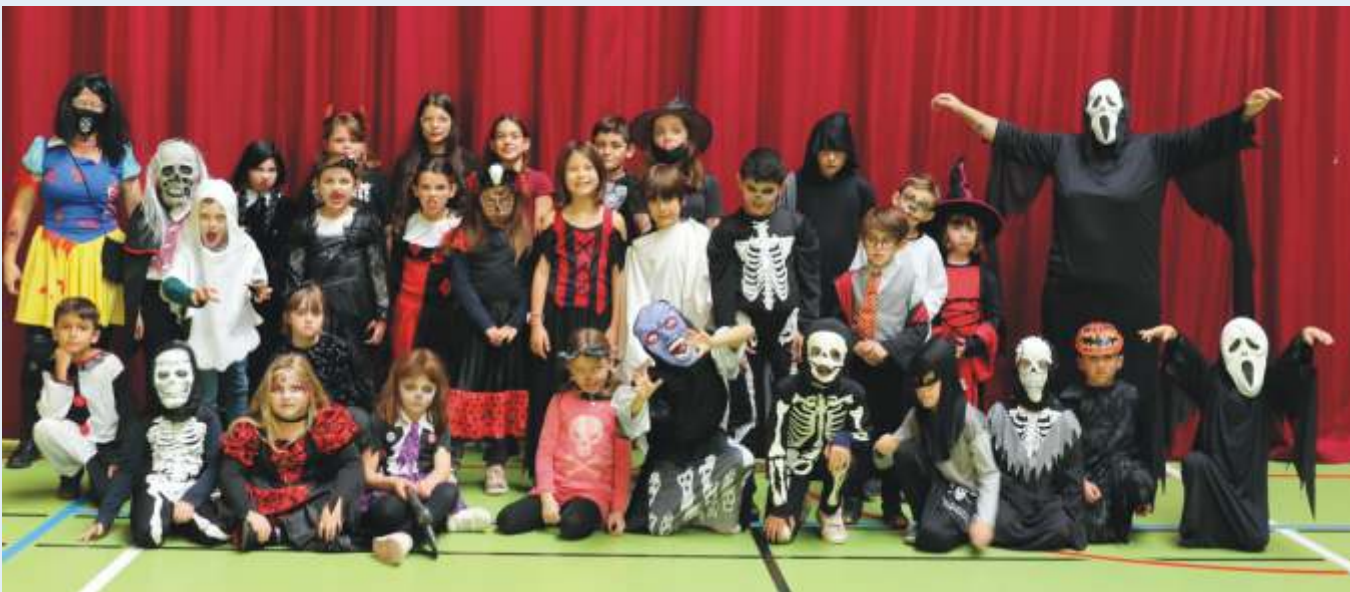
Tout au long de l'année différentes activités et sorties sont proposées aux jeunes de la commune

Animations sous réserve de l'évolution des mesures sanitaires