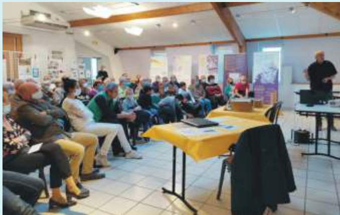
Exposition Moselle Déracinée