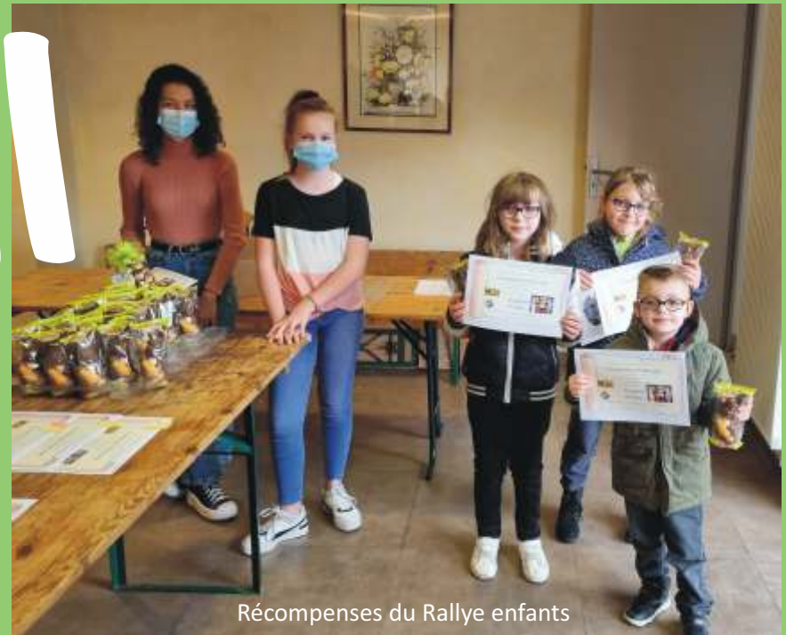
Récompenses du Rallye enfants