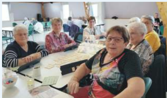
Foyer le Bel Âge