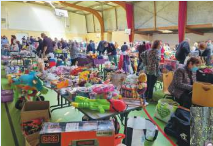
Bourse aux jouets