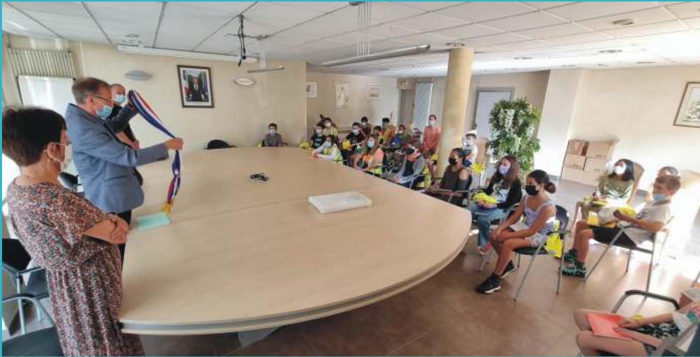
Visite citoyenne à la Mairie pour les élèves de CM2