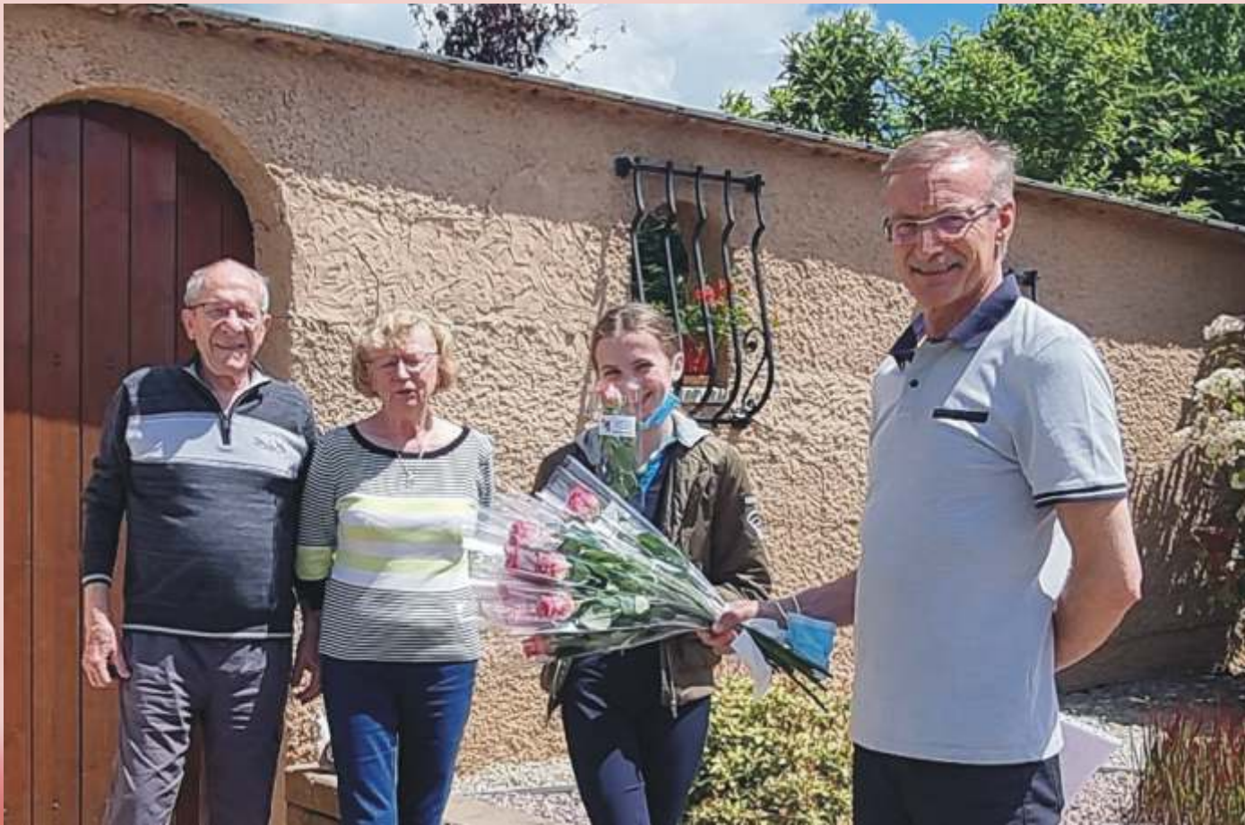
Traditionnelle rose offerte à chaque femme de la commune pour la fête des Mères.