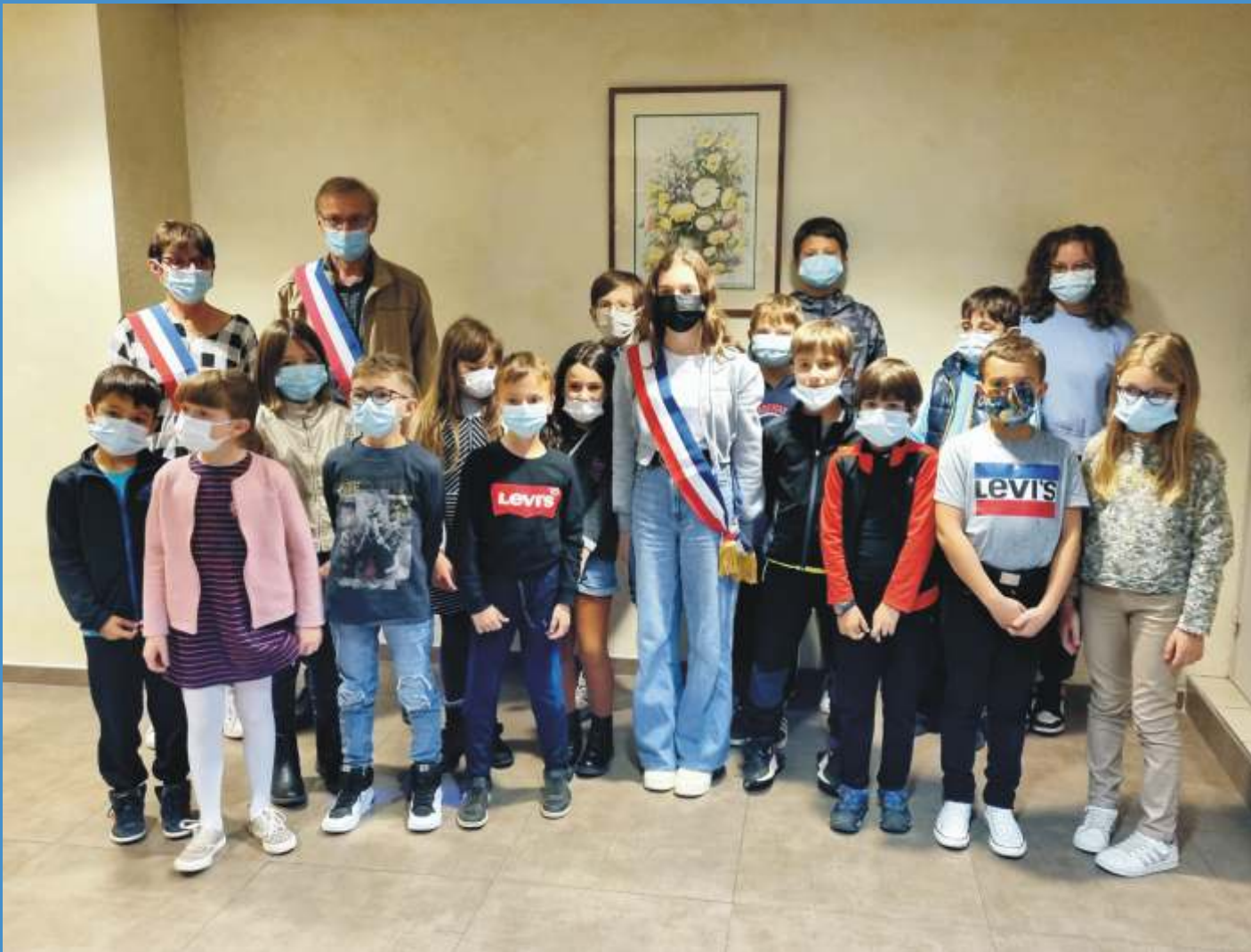
Mise en place du nouveau CMJ : 17 jeunes investis pour notre village !