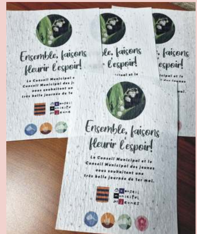
A l'occasion du 1er mai, le CMJ a distribué dans chaque foyer une carte à planter