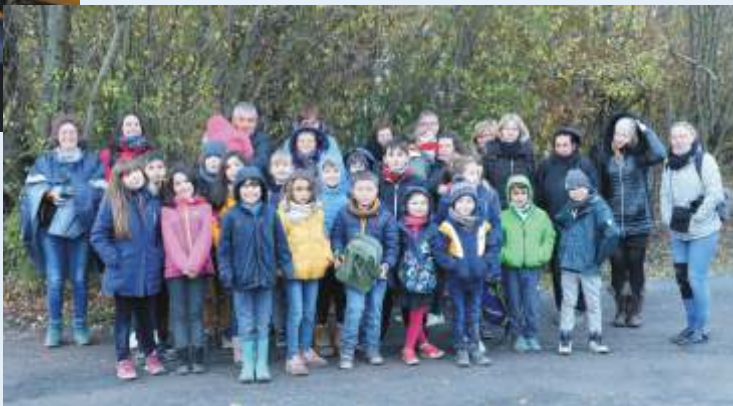
Sortie au Parc de Sainte Croix