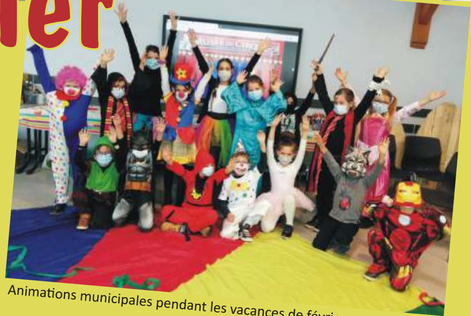
Animations municipales pendant les vacances de février