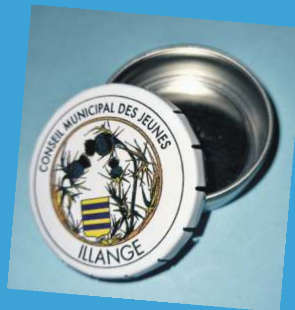
Cendrier de poche distribué par le CMJ aux parents d'écoliers