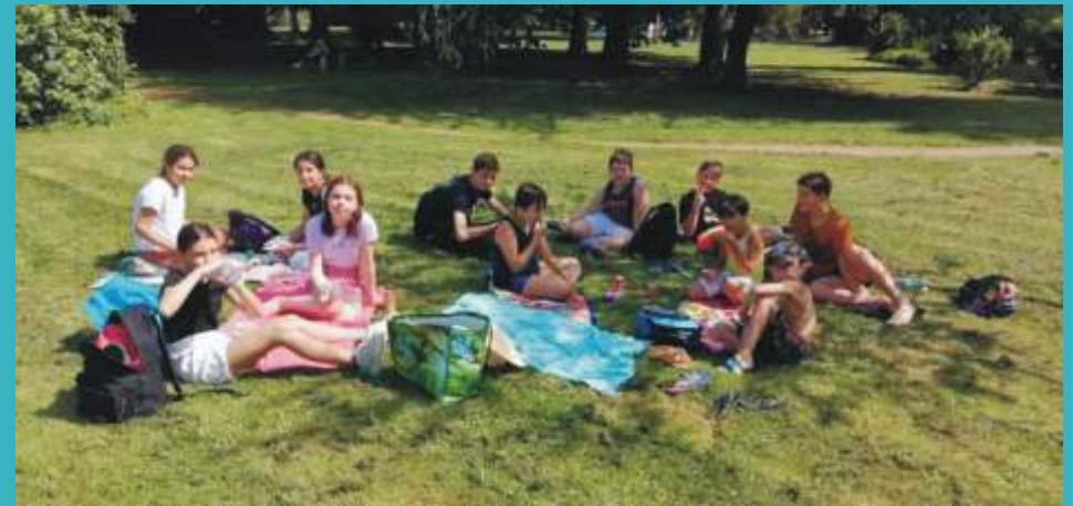
Pique-nique Moselle Wake Park