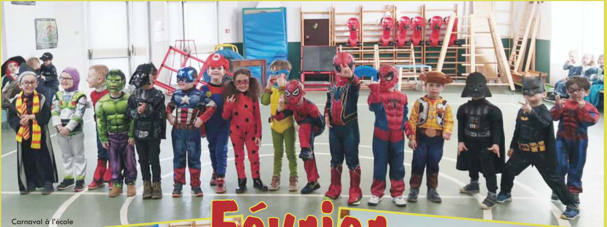
Carnaval à l'école