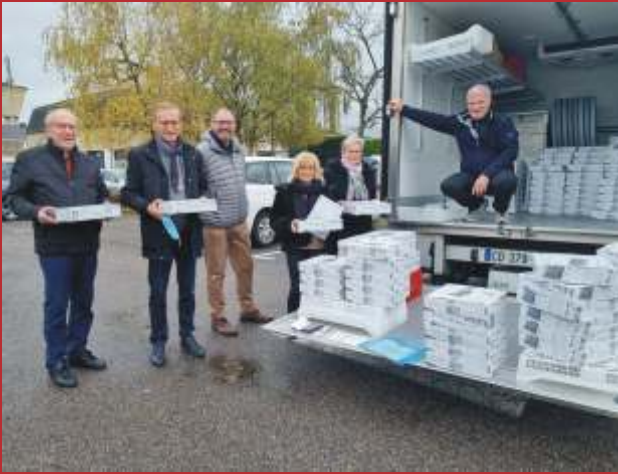
Repas du « Bel Age » livré à domicile par le conseil municipal et les membres du CCAS