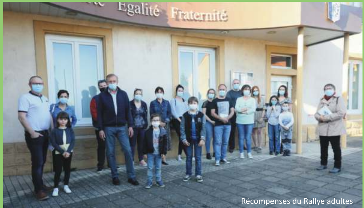
Récompenses du Rallye adultes