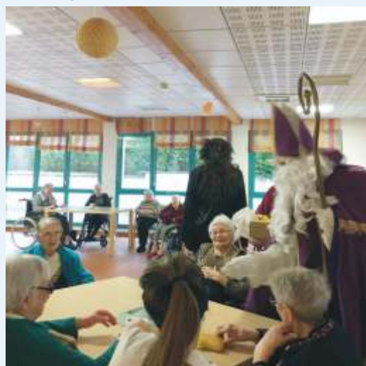
Saint Nicolas avec les résidents de l'Ehpad

Animations sous réserve de l'évolution des mesures sanitaires