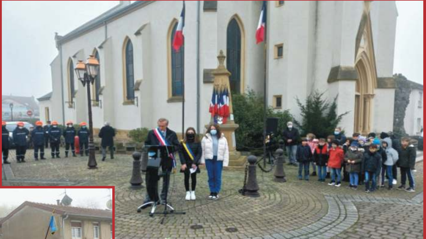
Commémoration 11 novembre