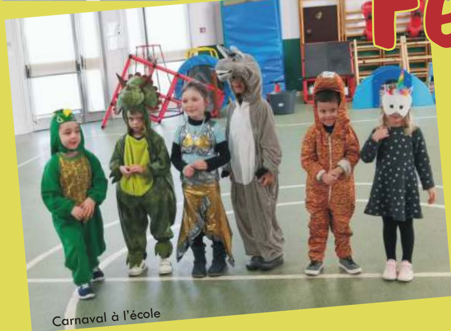
Carnaval à l'école