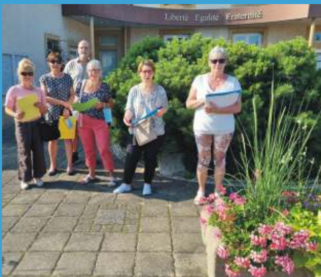
Jury des maisons fleuries

Le travail réalisé par les services techniques municipaux dans le fleurissement et l'entretien éco responsable des espaces verts de la commune mais également l'investissement de chacun, contribuent à nous offrir à tous un cadre de vie agréable.