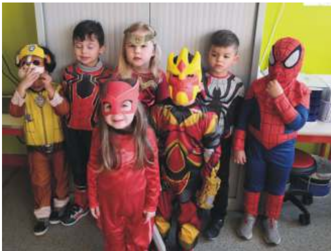
Petite et moyenne section