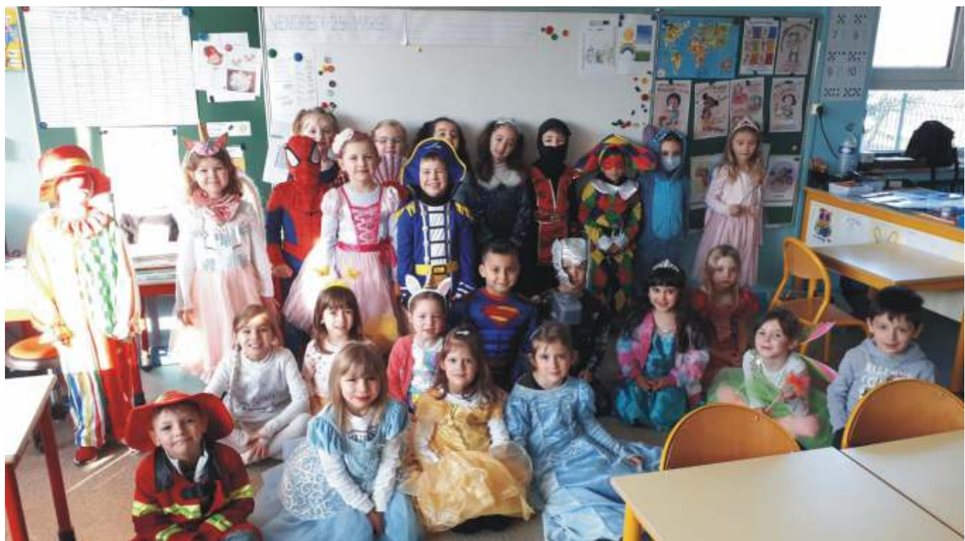
Moyenne et grande section