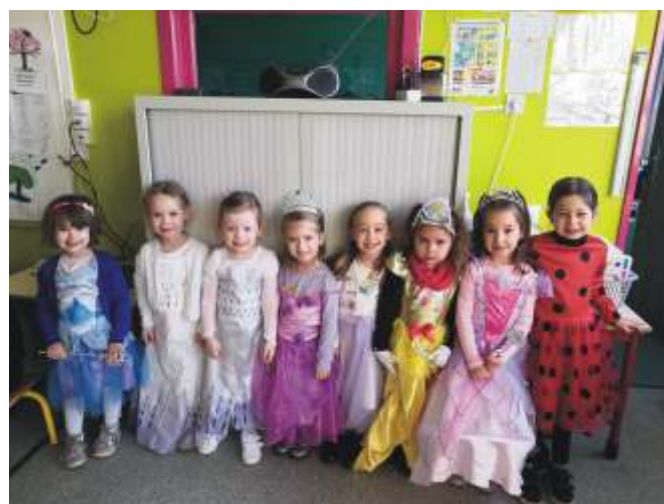
Petite et moyenne section

Carnaval, avec son défilé de costumes colorés divers et originaux, a fait son retour à l'école pour célébrer l'arrivée du printemps.