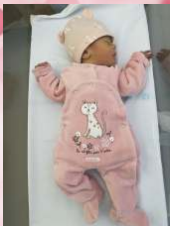
LE LOARER Louise née le 7 novembre 2021