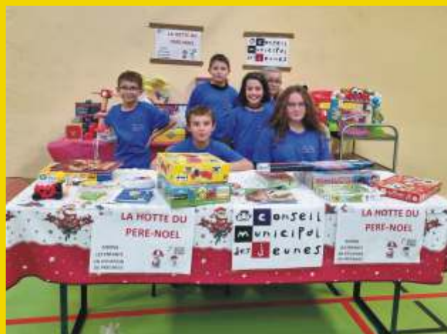
Collecte de jouets au profit d'enfants défavorisés