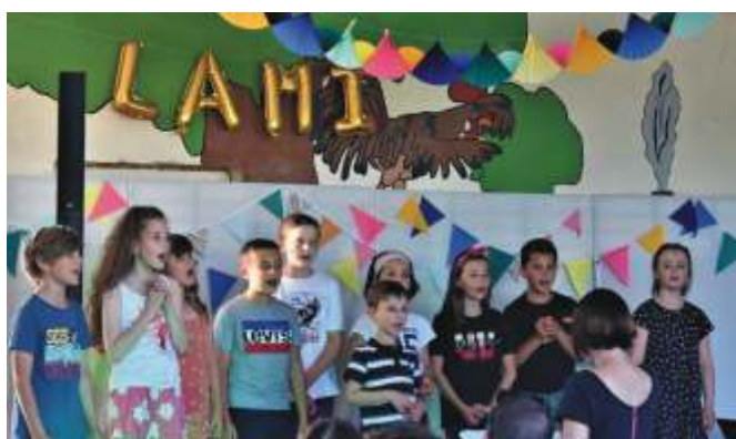
Audition de fin d'année de LAMI