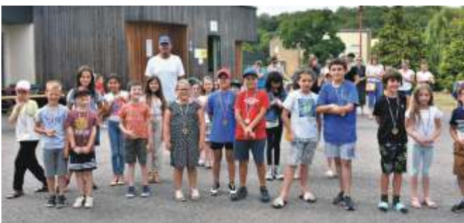
Récompenses aux jeunes du Tennis