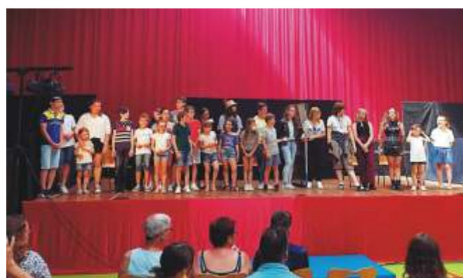
Représentation théâtrale de l'Île en Joie