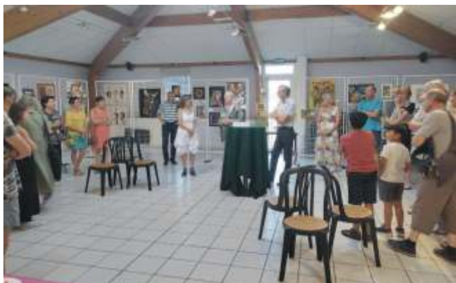
Exposition de dessins de Loisirs et Culture