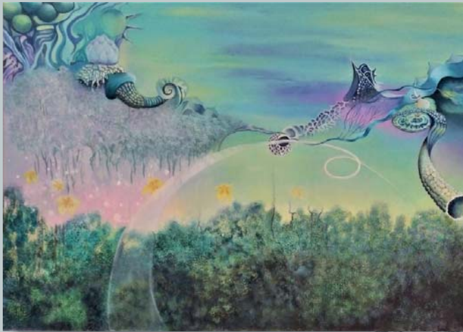
Voyage onirique Brigitte Pinel 15 et 16 mars