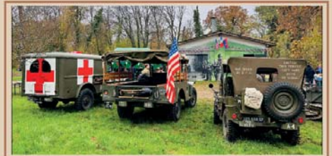
Un fort dans l'histoire Mairie d'Illange 10 au 18 mai