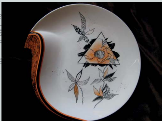
Peinture sur porcelaine Michèle Couedic 27 et 28 septembre