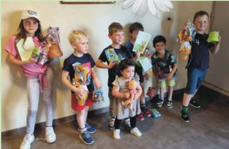
Rallye et concours de Pâques