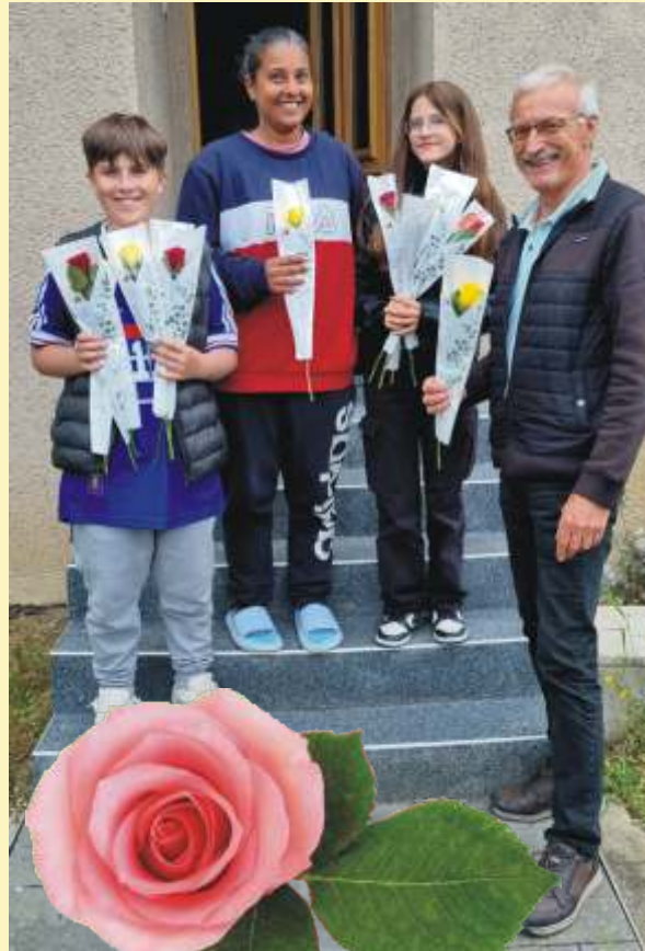
Fête des mères