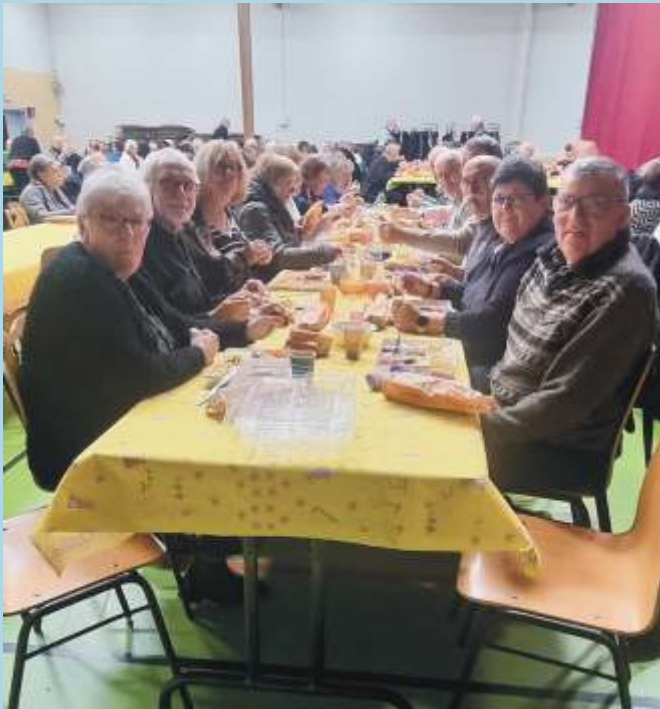
Repas des décorations