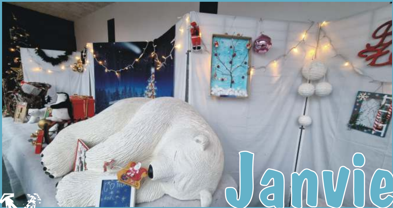
Concours des cadres de Noël