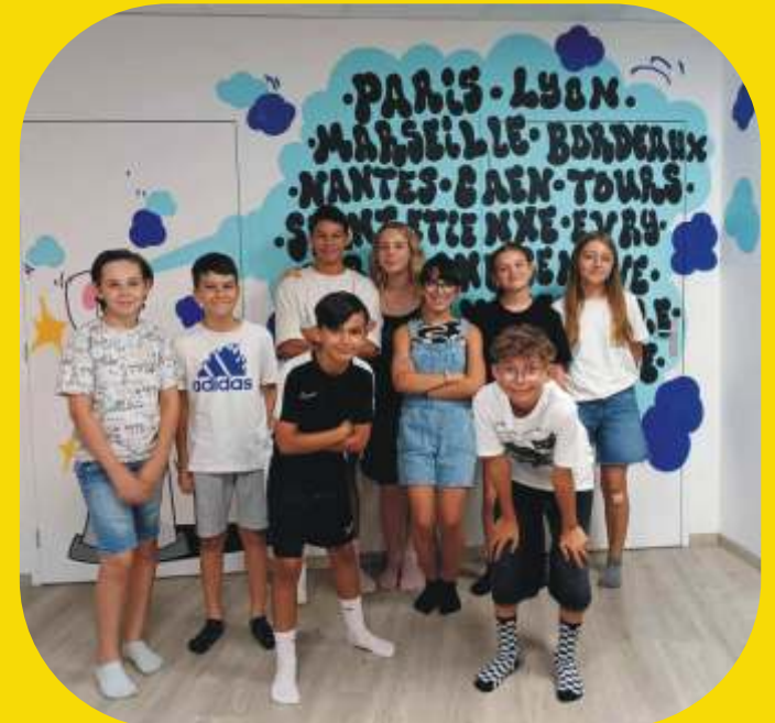
Sortie des ados - Animations jeunesse