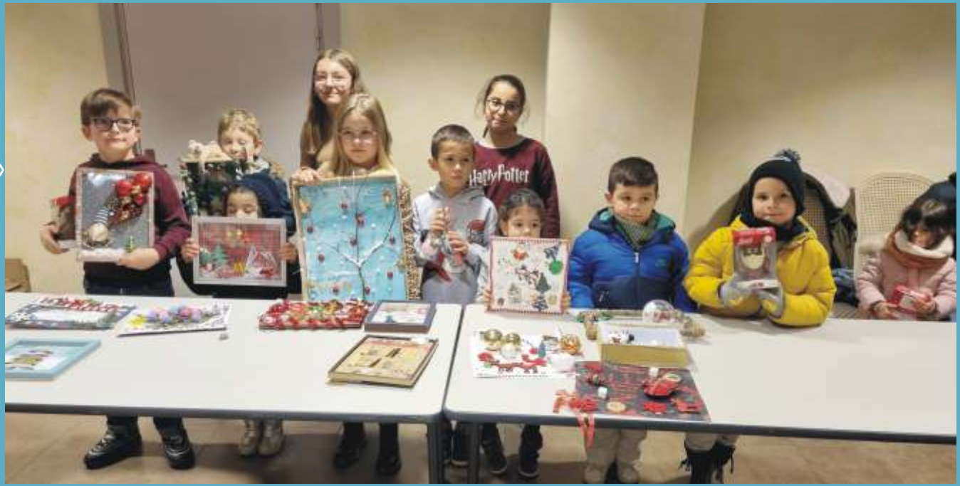
Lauréats du concours des cadres de Noël