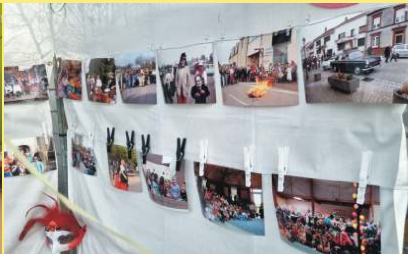
Exposition rétrospective de carnaval de 1975 à 2020