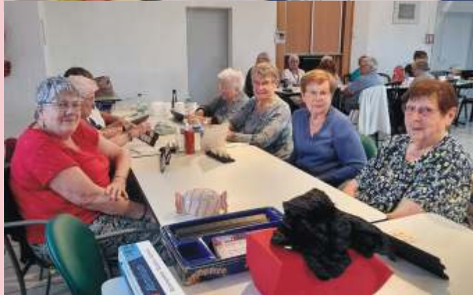
Foyer du Bel Âge