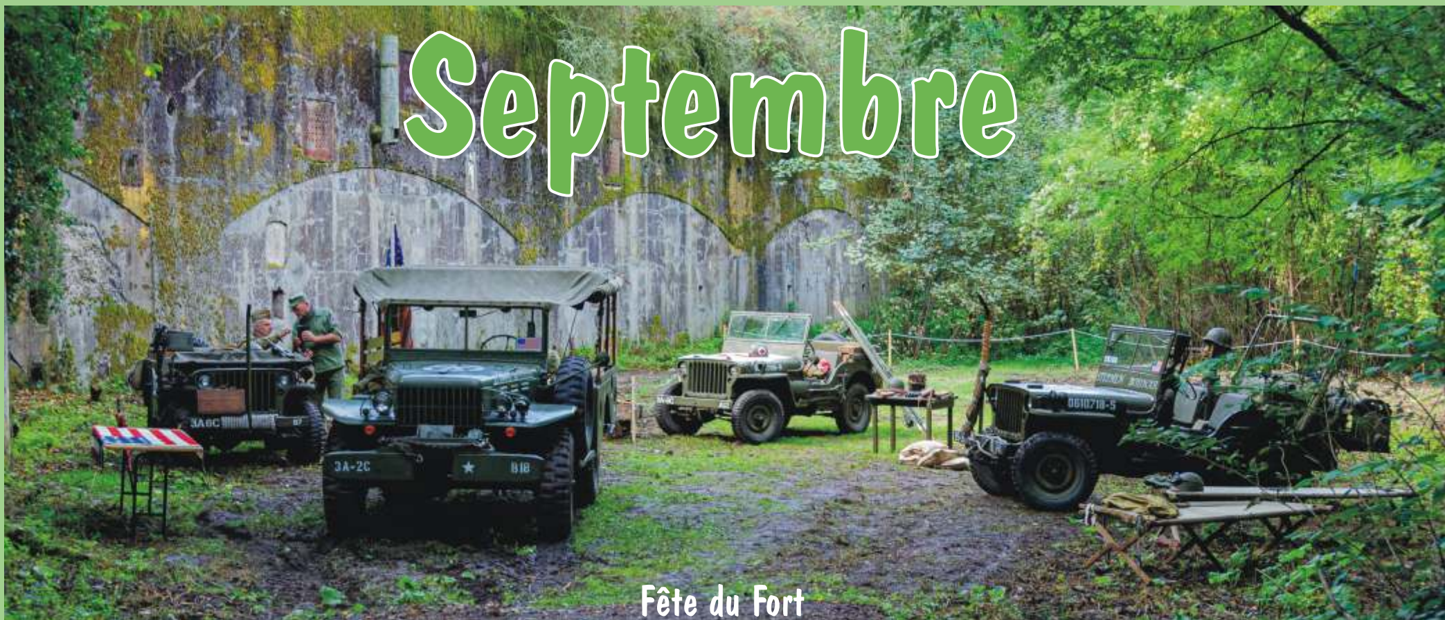
Fête du Fort