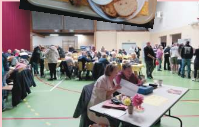
Petit déjeuner de la bibliothèque