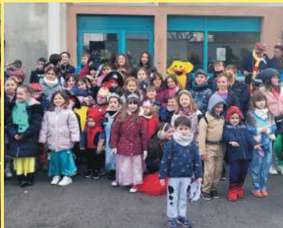
Carnaval de l'APE