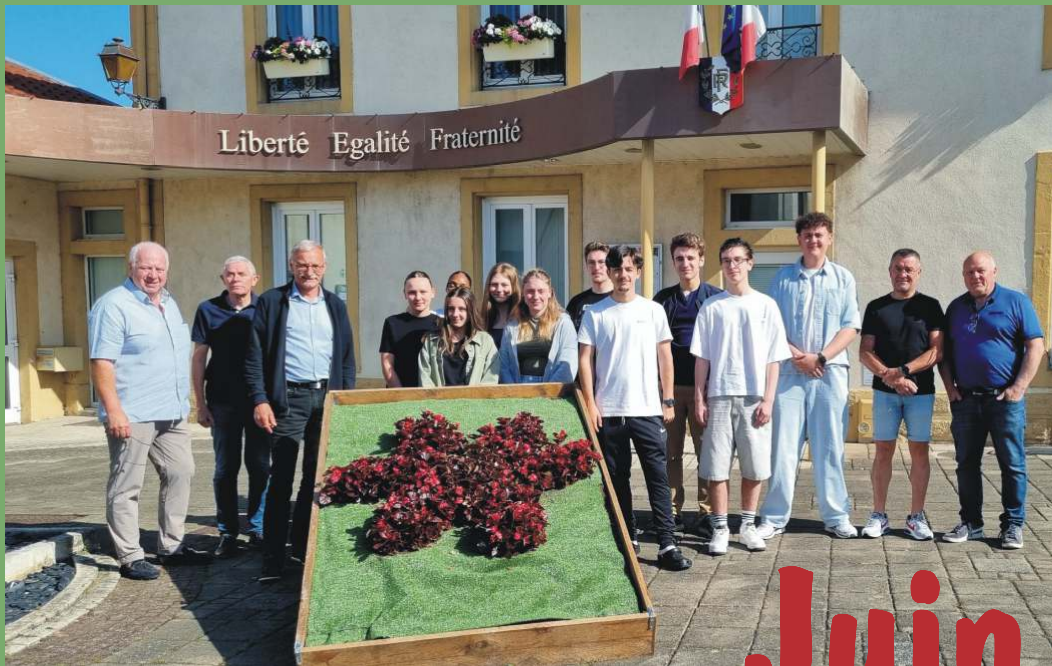
Accueil des saisonniers en mairie