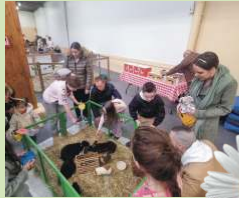
Fête de printemps