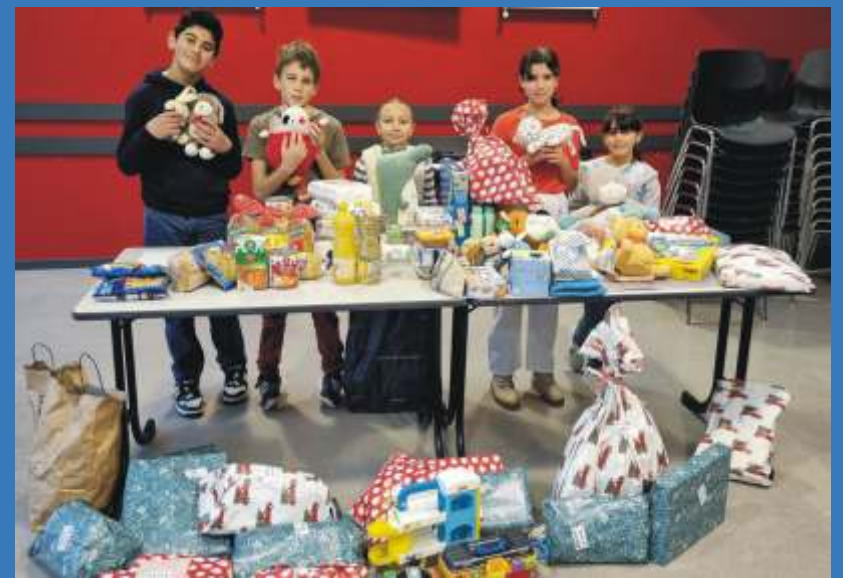
Premier engagement solidaire du nouveau CMJ : collecte de jouets et de denrées au profit des plus défavorisés