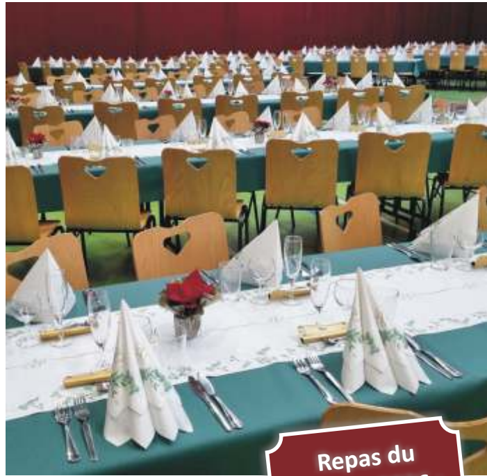
Repas du Bel âge