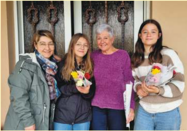
Fête des mères