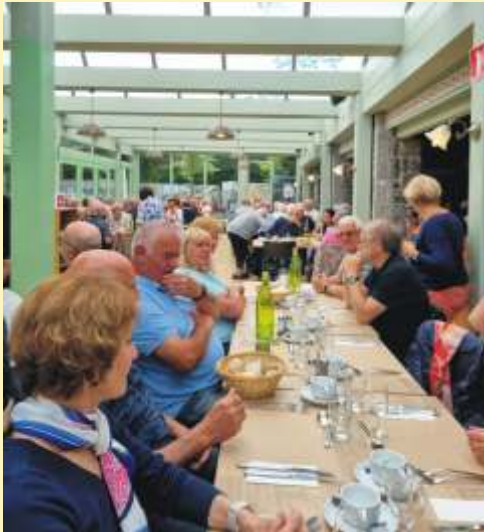
Sortie du Bel Âge aux grottes de Han