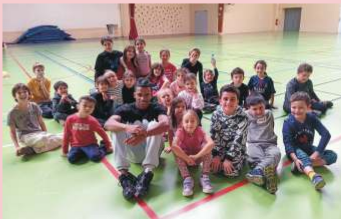
Animations jeunesse vacances de la Toussaint