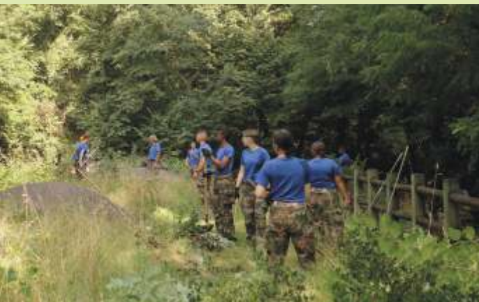
Service militaire volontaire