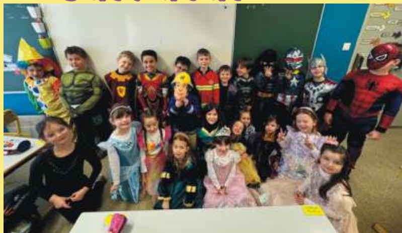
Carnaval à l'école