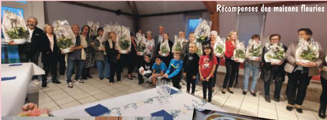
Récompenses des maisons fleuries