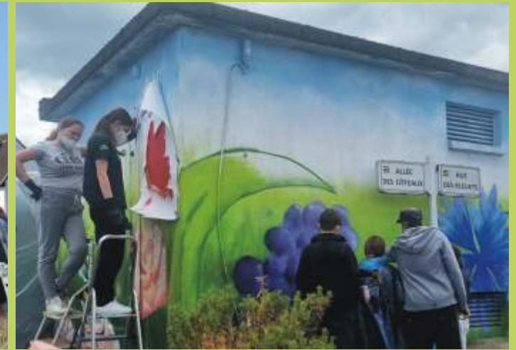
Customisation du transformateur