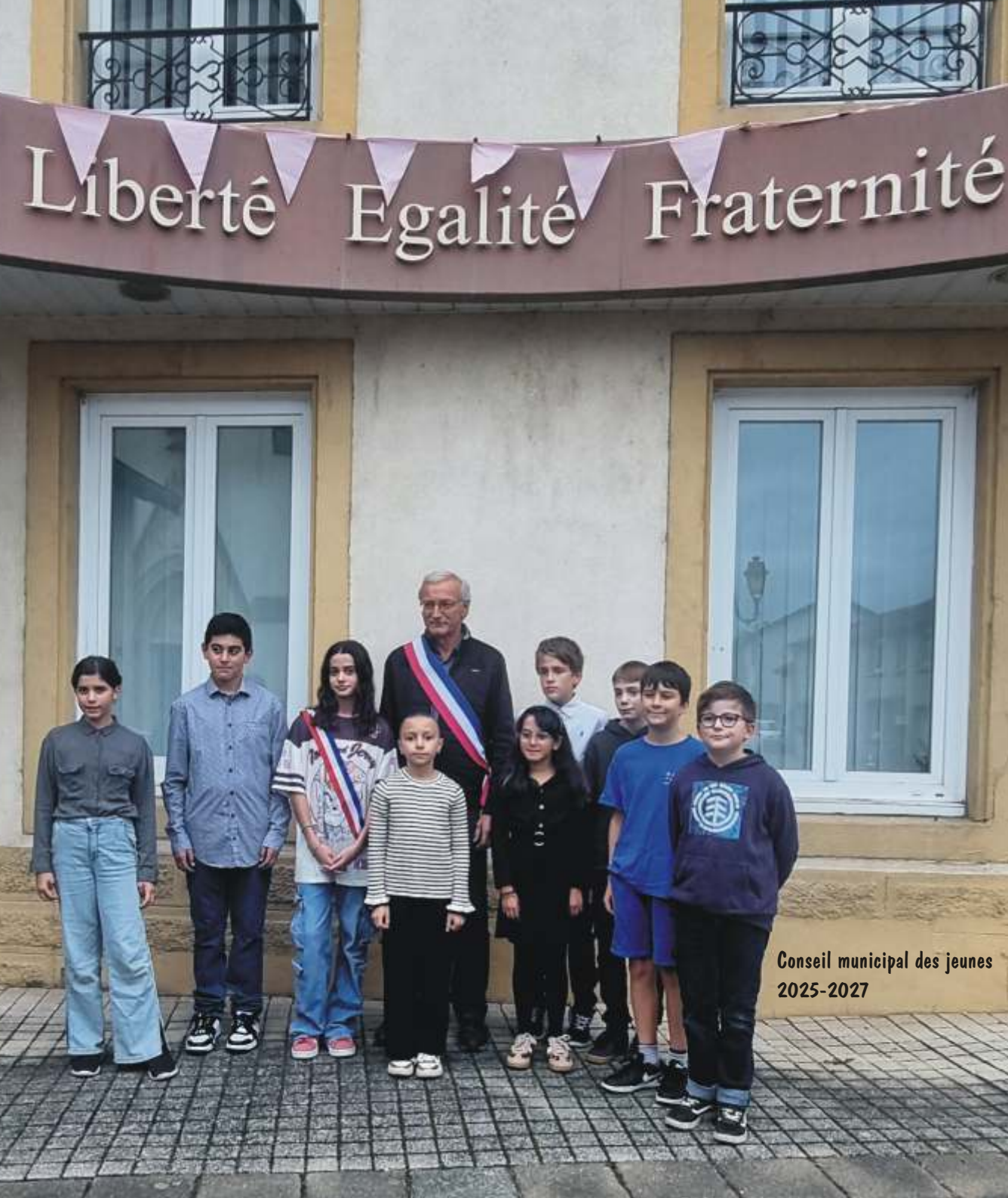
Conseil municipal des jeunes 2025-2027