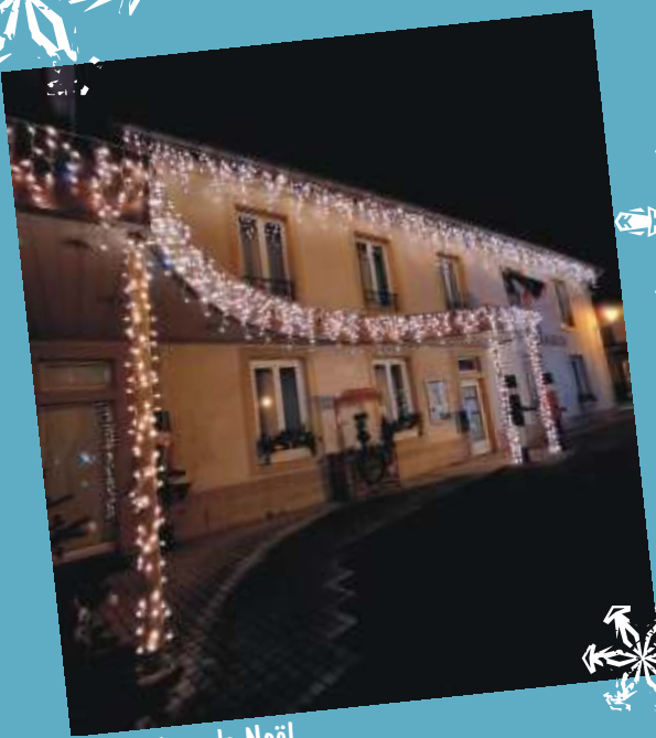
Décorations de Noël