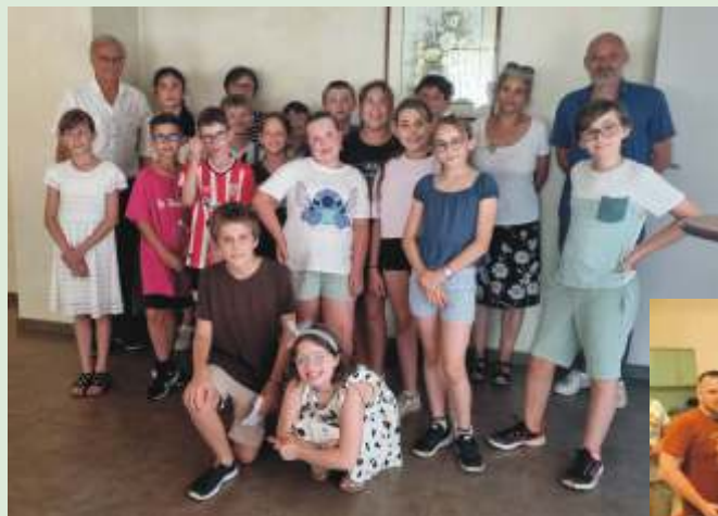
Visite citoyenne des CM2 en mairie