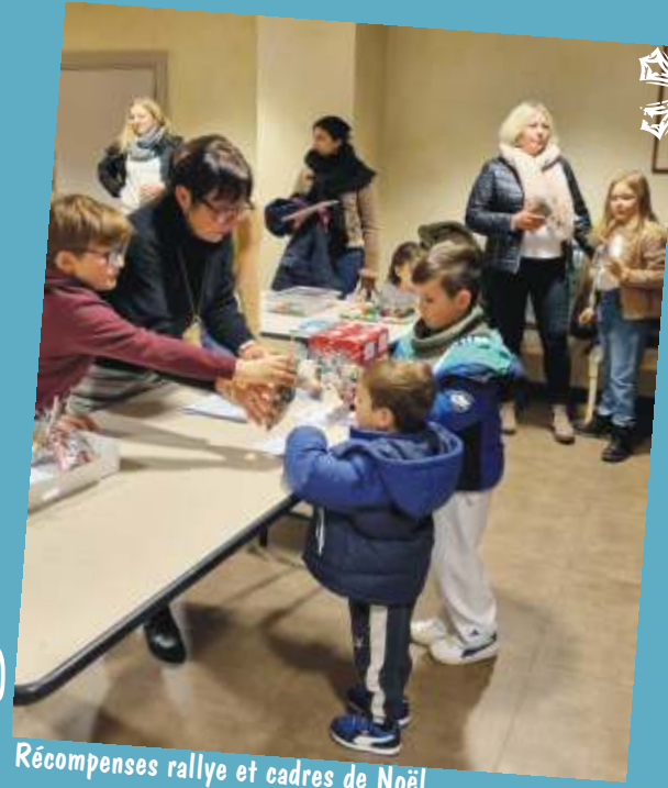
Récompenses rallye et cadres de Noël