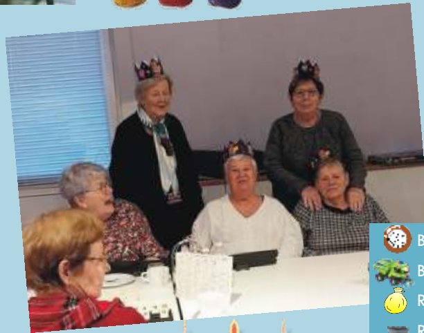
Epiphanie au Bel âge