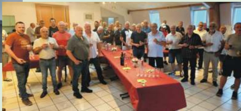
Fête des pères