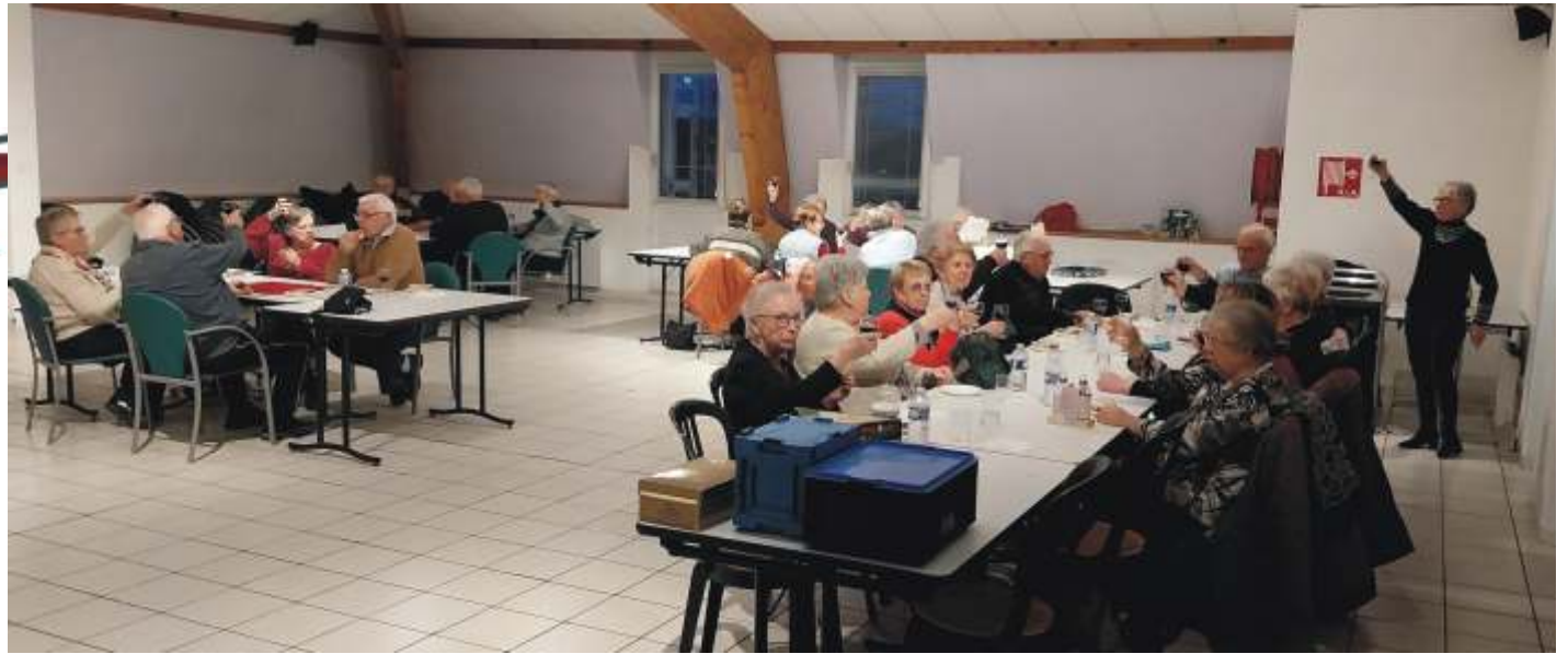
Dégustation de Beaujolais nouveau au Foyer (avec modération)