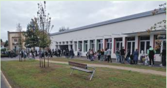
Rentrée des classes