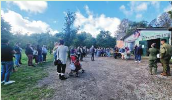
Verre de l'amitié