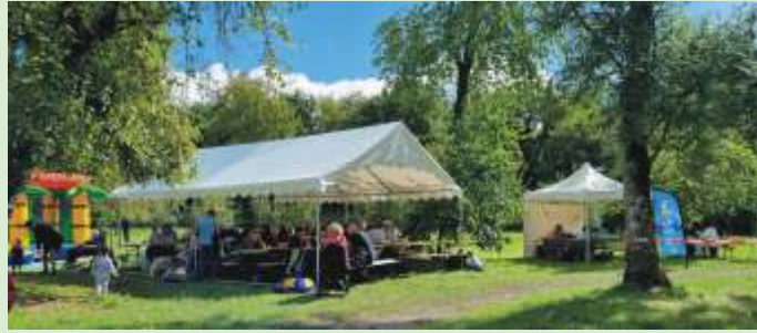
Journée du Fort