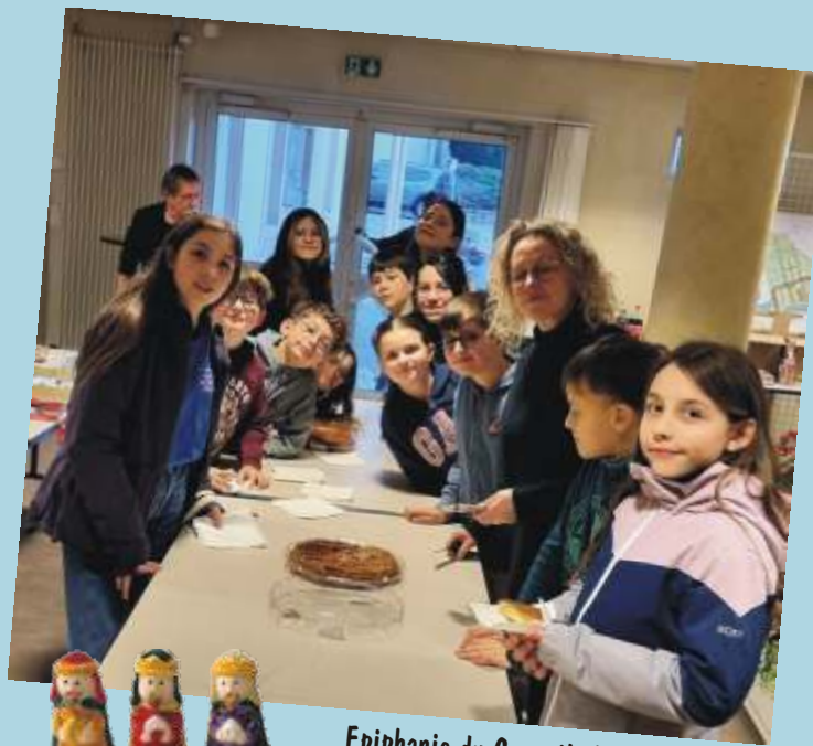
Epiphanie du Conseil Municipal Jeunes