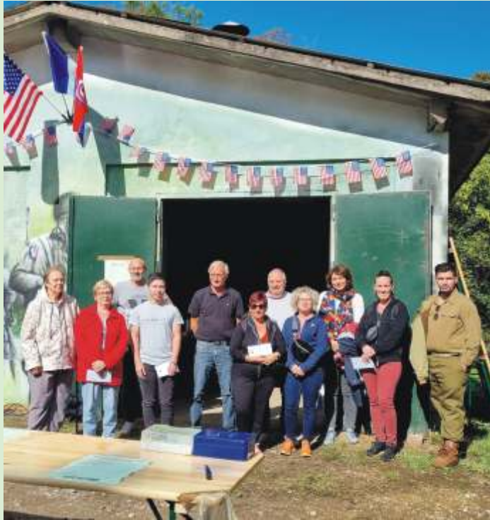
Récompenses des méritants