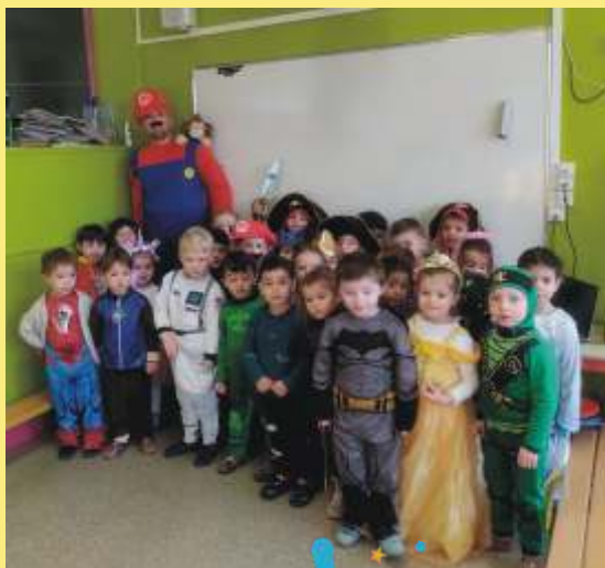
Carnaval à l'école