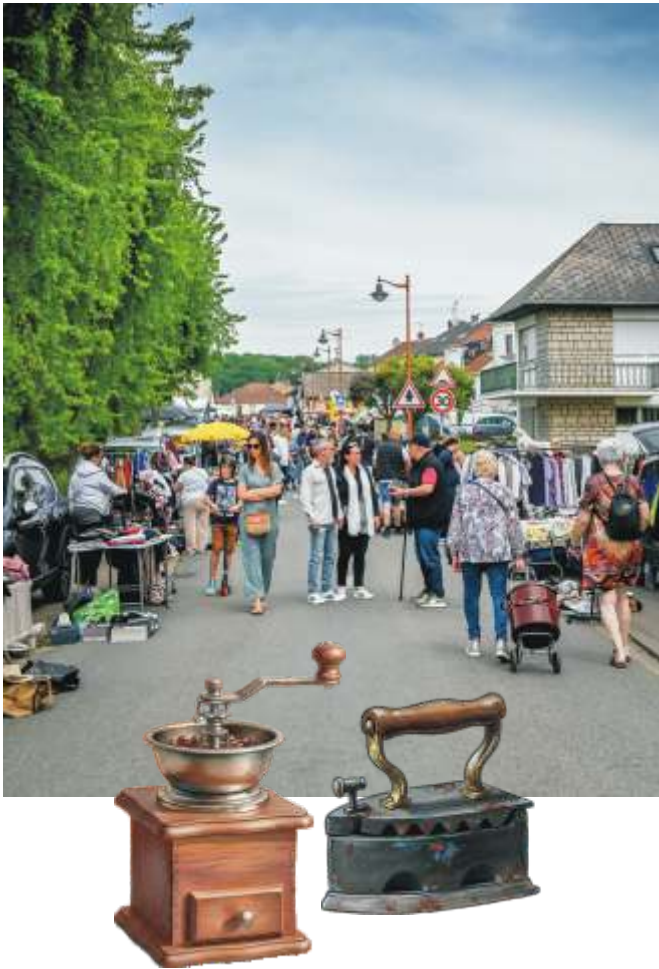
Conseil de fabrique