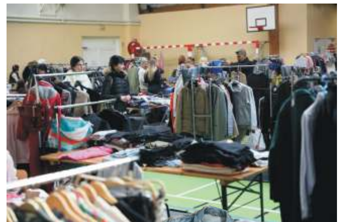
Vide dressing de la Gym Volontaire