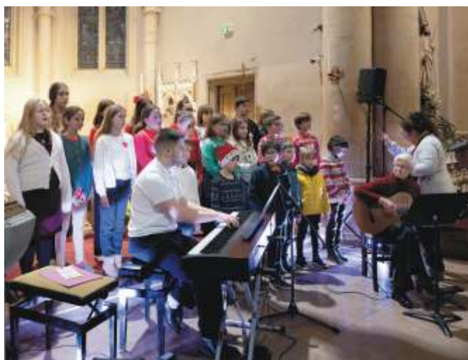
Concert de Noël