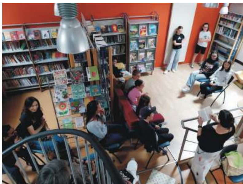
Bibliothèque en scène