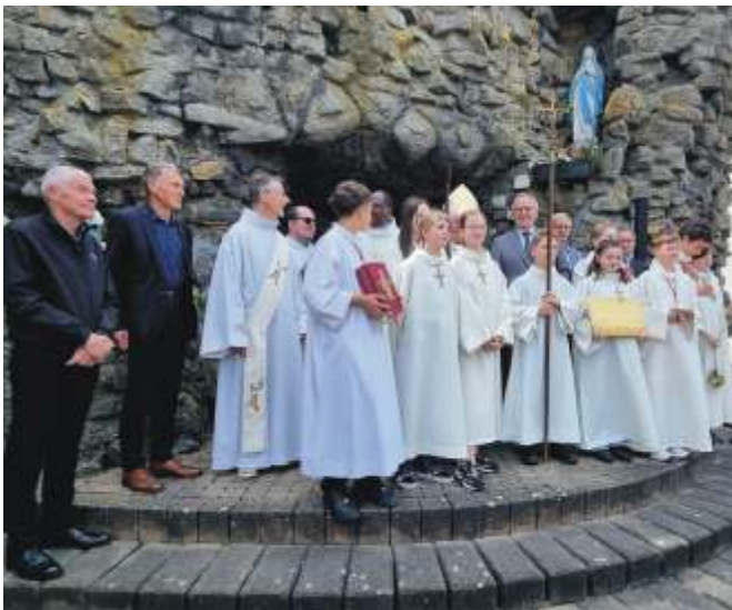
Fête de la grotte le 10 mai 2026