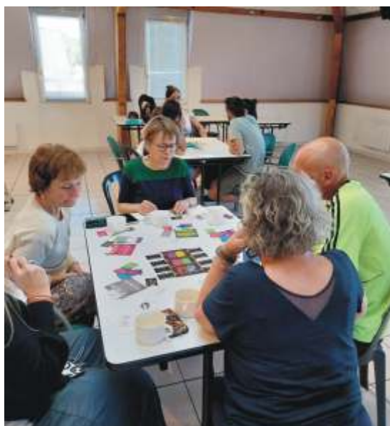
Jeux de société