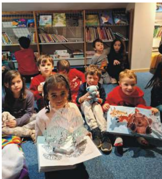
Contes de Noël

En plus de mettre à disposition un large éventail d'ouvrages ainsi qu'un service de prêt de jeux de société favorisant la convivialité et le partage, la bibliothèque, soutenue par l'engagement actif de ses bénévoles, déploie tout au long de l'année, une programmation culturelle riche et diversifiée. Celle-ci se traduit par l'organisation régulière d'animations, d'ateliers et d'expositions thématiques, destinés à tous les publics et souvent en collaboration avec d'autres associations. Ces initiatives visent non seulement à promouvoir la lecture et la culture sous toutes leurs formes, mais également à faire de la bibliothèque un véritable lieu de vie, d'échange et de découverte au cœur du village.