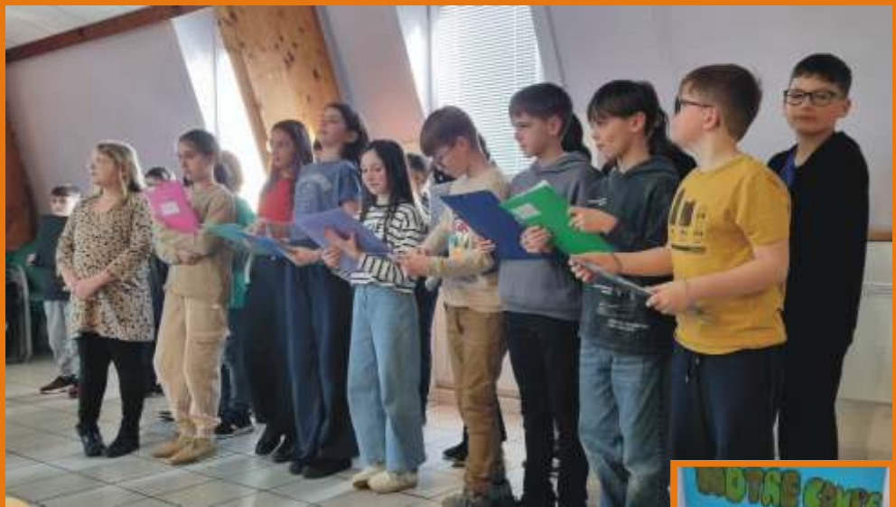
Retour d'expérience des élèves

En fin de journée, toutes les équipes se sont retrouvées pour assister à un match de l'Open de Moselle, un moment particulièrement marquant pour tous. Les élèves ont ensuite partagé leur expérience lors d'une rencontre en présence des élus, des officiels, de leurs enseignantes et de leurs familles.