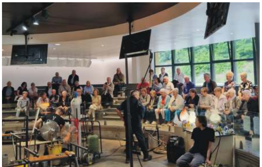
Cristallerie de Lehrer

Les participants ont ensuite partagé un agréable repas du midi à l'auberge Katz, à Dabo, dans une ambiance chaleureuse et conviviale.